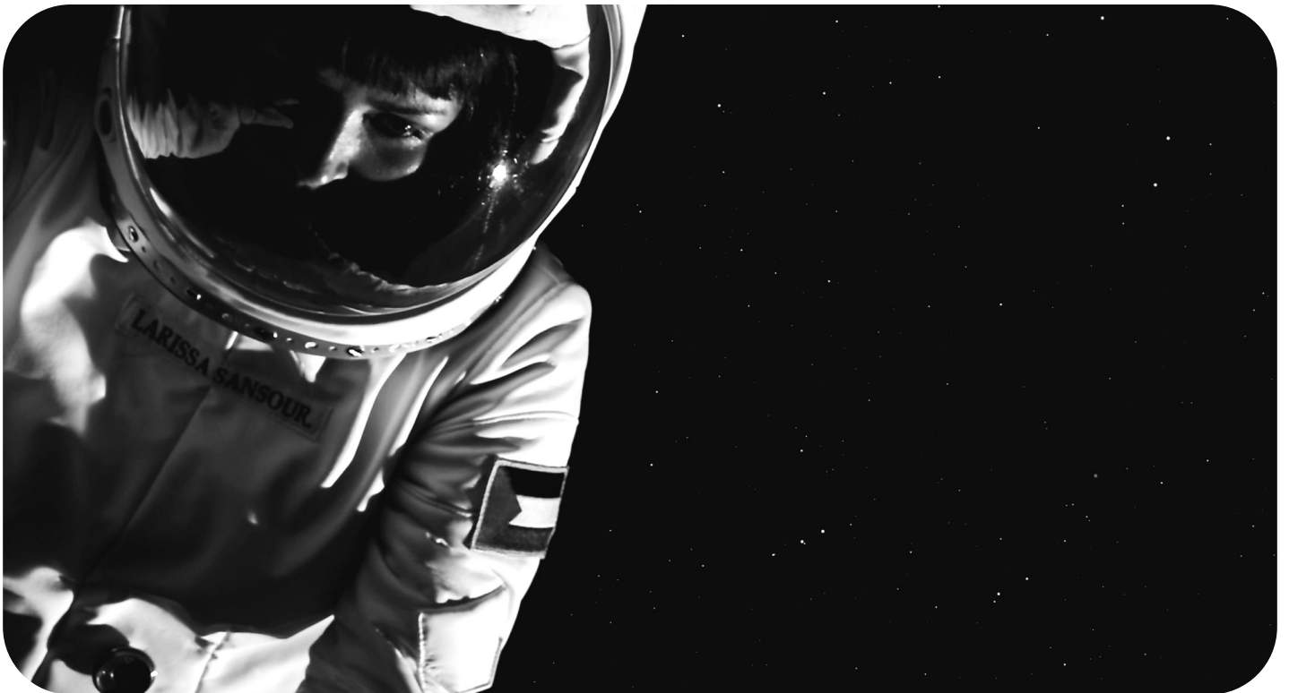
Larissa Sansour: Space Exodus , 2009.

Nelly Ben Hayoun-Stépanian: Doppelgänger 3 , 2024, 73'